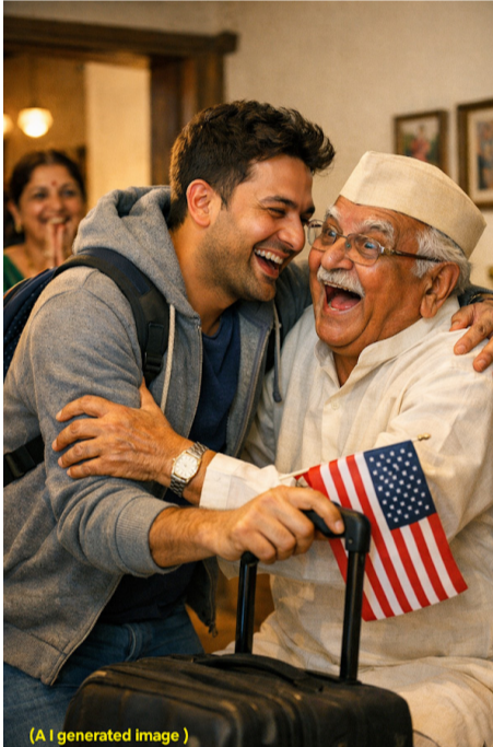
(AI generated image)