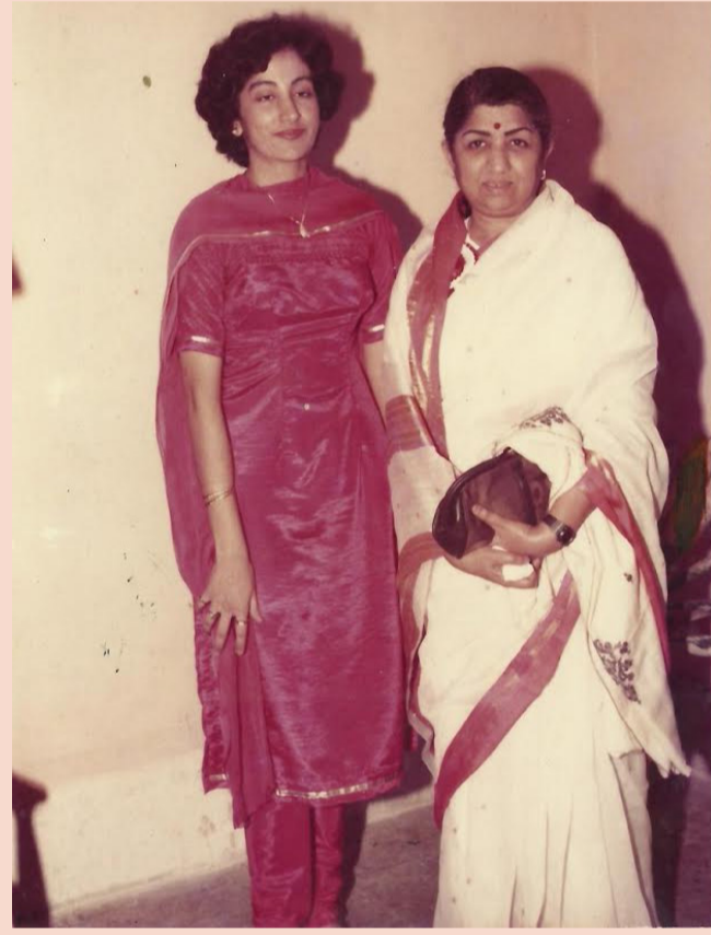
चित्रपटसृष्टीतील काही गीते त्यांनी गायली आहेत. ना. धों. महानोरांची